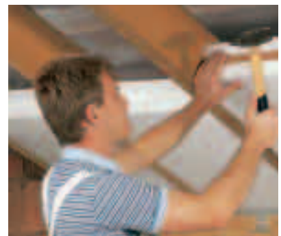
5. Platteneinheit mit leichten Hammerschlägen nach unten treiben (Latte unterlegen), bis Nut und Feder dicht schließen.