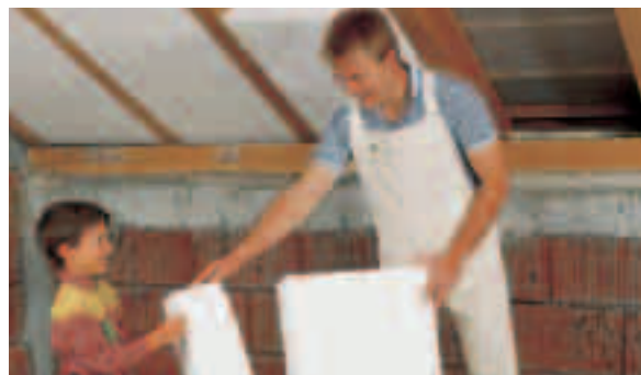
Rationell: Jeder Rest ist ein neuer Anfang.