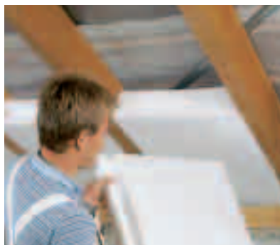
4. Platteneinheit an Sparrenkante ansetzen, zwischen die Sparren einklemmen und bündig eindrücken.