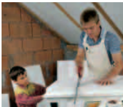
3. Styrotect-S Dämmplatte z. B. als Paßstück für den Firstbereich zuschneiden und einpassen.

Styrotect-S ist geschlossenzellig, wasserabweisend, formstabil und schwer entflammbar. Dadurch bleibt seine hohe Dämmwirkung dauerhaft erhalten.