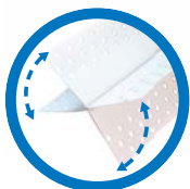
Rigips® AquaBead® Flex PRO Rolle 25 Meter