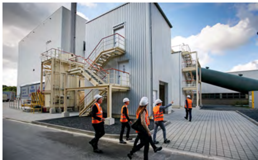
Recyclinganlage in Gelsenkirchen-Scholven am Tag der Eröffnung (13.07.2017).